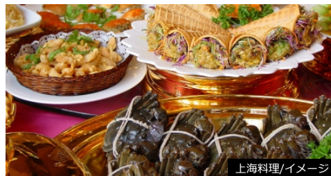
上海料理/イメージ